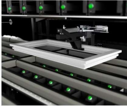
Table de montage des ferrures équipée de deux stations de vissage indépendantes pour travailler simultanément sur deux côtés du cadre, avec la possibilité d'insérer également un troisième chargeur pour les vis spéciales.