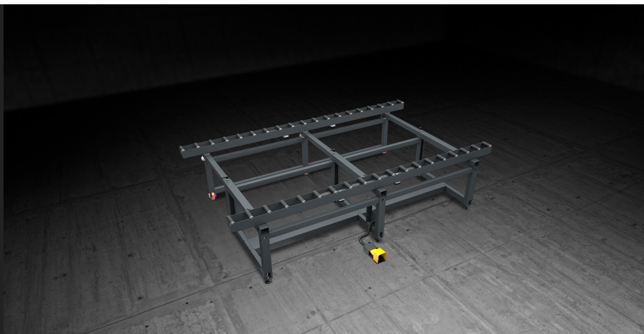
Table modulaire de grandes dimensions conçue pour le montage et la manutention en ligne de cadres de murs-rideaux. Equipée de deux chemins d'amenage recouverts d'une gaine en PVC souple; le réglage de la distance entre les deux chemins d'amenage est fonction de la largeur de la pièce. Un système à actionnement pneumatique permet de bloquer les rouleaux durant les phases de travail.