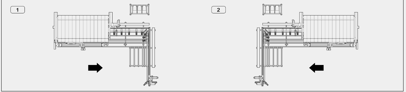
1 - Sol versiyon (soldan sağa)